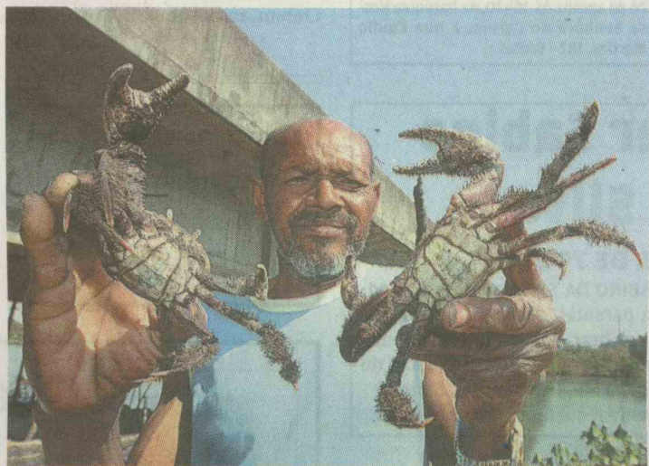
São tantos pescados e caranguejos que a dupla não consegue medir